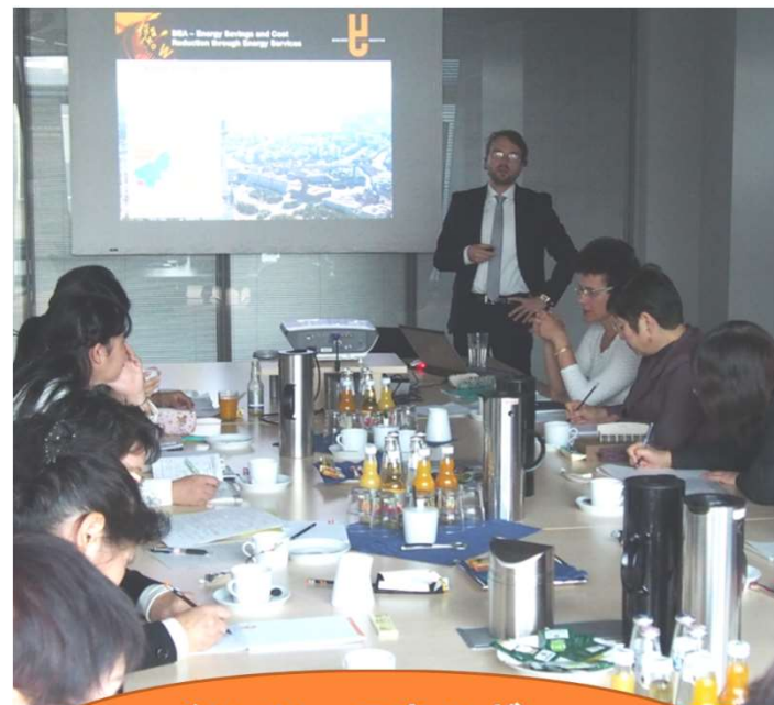
ベルリン・エネルギー・エージェンシー