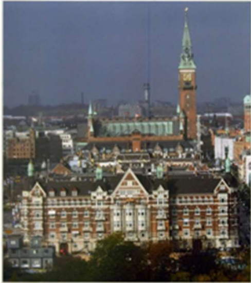
主催：とちぎつばさの会 海外研修実行委員会