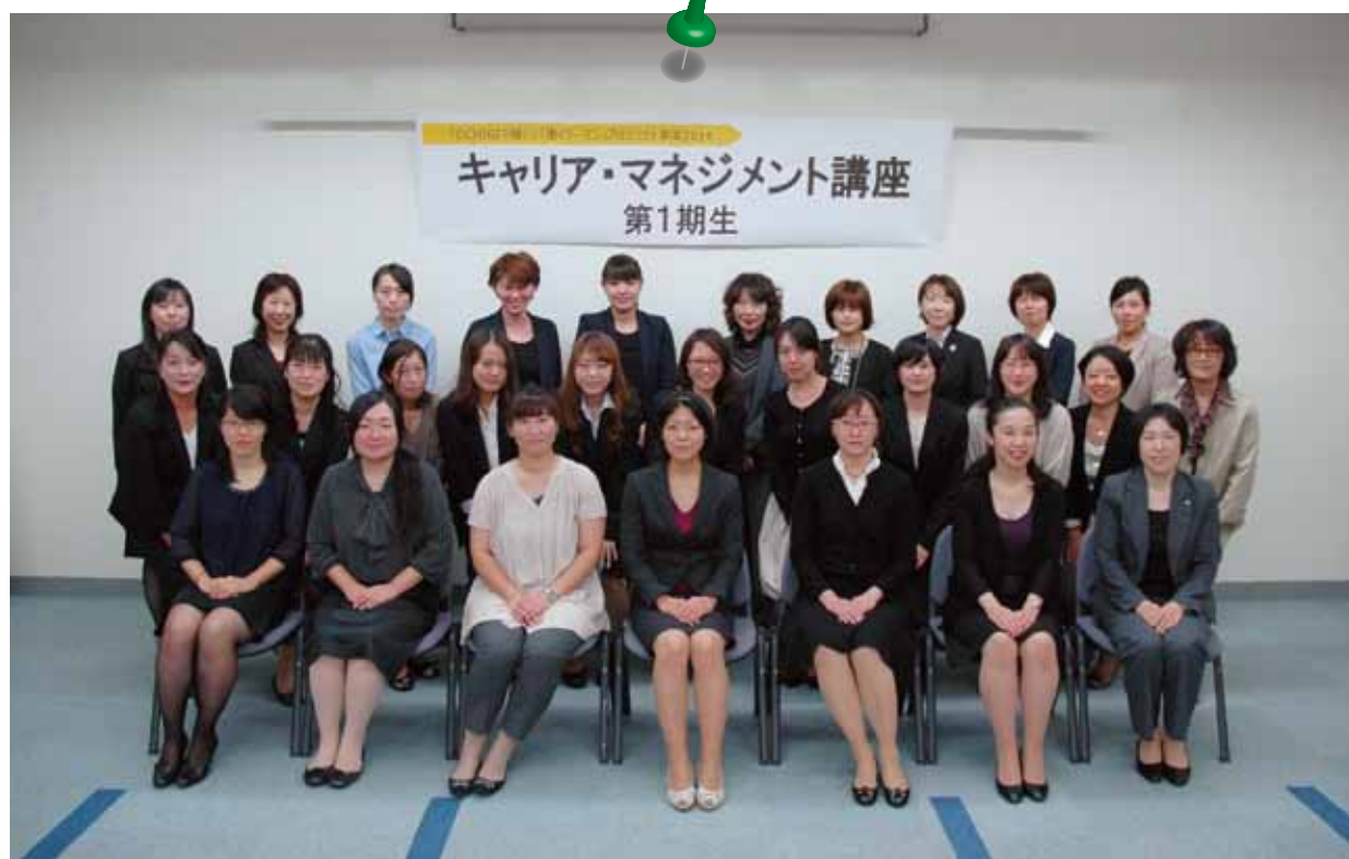
平成 26 年 10 月 9 日(木) 於：とちぎ男女共同参画センター